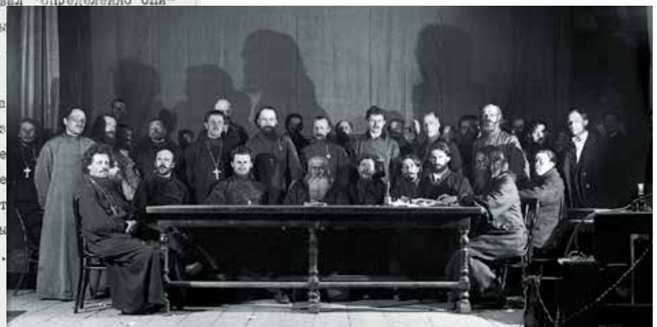
Президиум обновленческого лжесобора. 1923 г.

Обращение обновленцев во ВЦИК о возвращении Константинопольской Православной Церкви ее Московского подворья