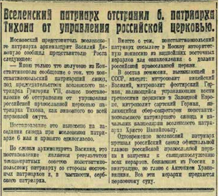
Газета «Известия». 1924 г.

Обращение обновленцев во ВЦИК о возвращении Константинопольской Православной Церкви ее Московского подворья